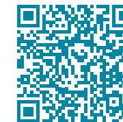
Cijfers YAR Coaching Oost-Vlaanderen